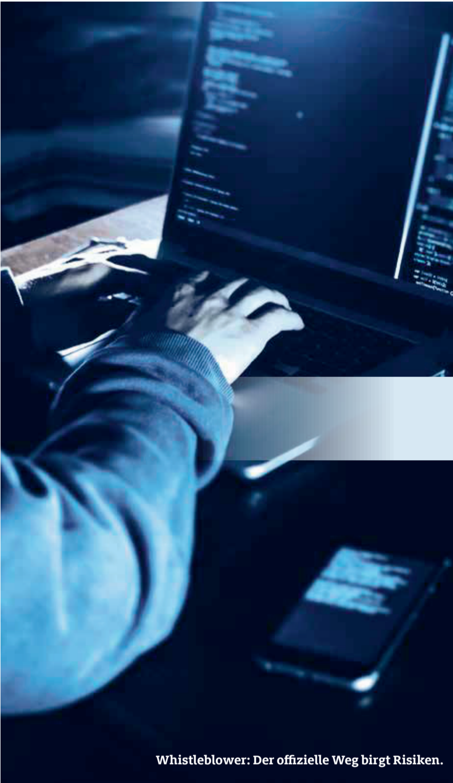
Whistleblower: Der offizielle Weg birgt Risiken.