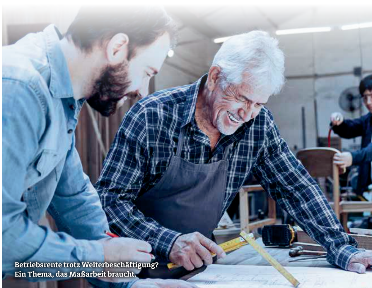
Betriebsrente trotz Weiterbeschäftigung? Ein Thema, das Maßarbeit braucht.

Die Versicherungswirtschaft reagiert mit besonderen Tarifgestaltungen und versucht, die Werkstattkosten unter Kontrolle zu halten. Versicherer verhandeln Reparatur-Tarife mit unterschiedlichen Ketten.